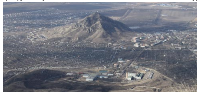
Вид на город Лермонтов с вершины горы Бештау.