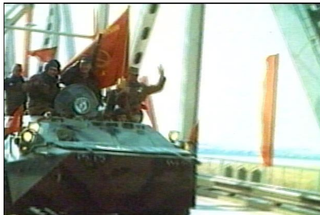
Кадры вывода советских войск из Афганистана.