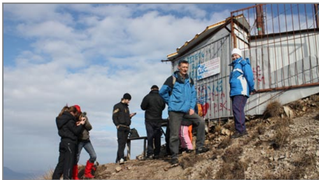
Вершина горы Бештау.